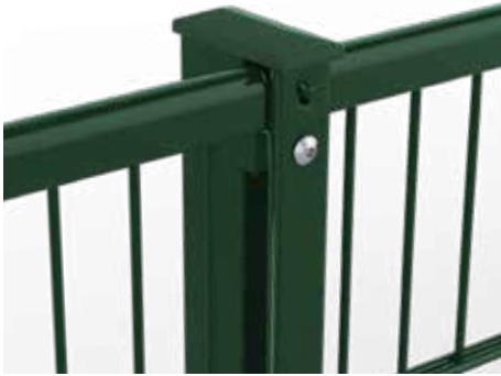
RANKO Profilschienenpfahl, vollständig aus Metall, hier mit Handlauf U-Profil auf der Doppelstabmatte