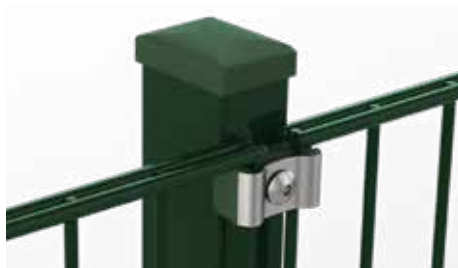
RANKO Multipfahl mit Klemmplatten mit kurzen Schenkeln