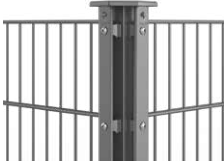
RANKO Profilschieneneckpfahl, für Ecken im Winkel von ca. 90°

Entsprechen den hohen Anforderungen der GUUV*