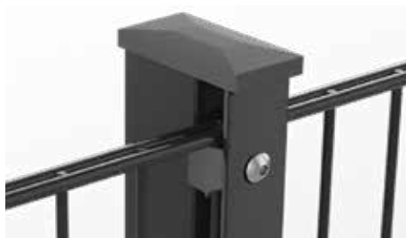
RANKO Multipfahl mit Flacheisen und Kappe mit Überstand