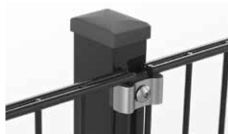
RANKO Multipfahl mit Klemmplatten mit langen Schenkeln