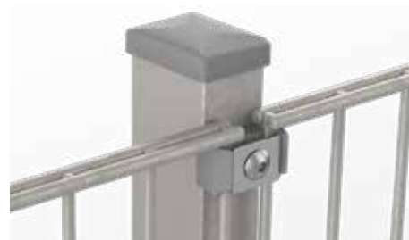
RANKO Multipfahl mit Flachklemmplatten