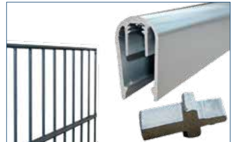
U-Profil für Typ 8/6/8 OHNE Überstände mit Adaptern (Zubehör)