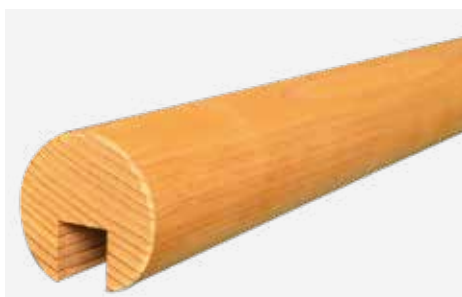
Bosco Rondo zum Aufstecken NACH der Zaunmontage