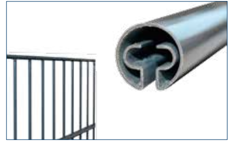
Rundprofil für Typ 8/6/8 OHNE Überstände