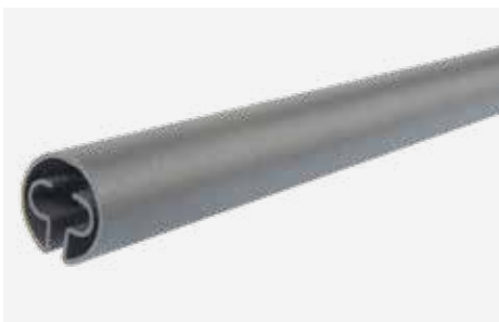
Rundprofil zum Aufschieben VOR der Zaunmontage

Entspricht den Vorschriften des GUVV (Gemeindeunfall- versicherungsverband)!