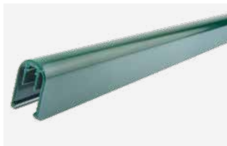
U-Profil zum Aufstecken NACH der Zaunmontage