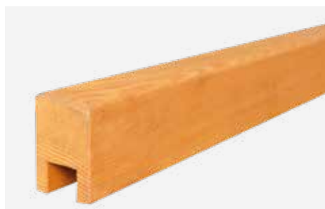
Bosco Acanta zum Aufstecken NACH der Zaunmontage