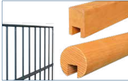
Bosco für Typ 8/6/8 OHNE Überstände

WELCHER HANDLAUF FÜR WELCHE DOPPELSTABMATTE?