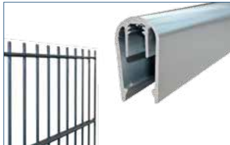
U-Profil für Typ 8/6/8 und Typ 6/5/6 MIT Überständen