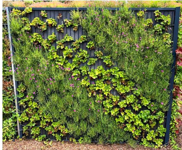
Wachstums-Plus: tolle Ergebnisse schon nach ca. 2 Monaten