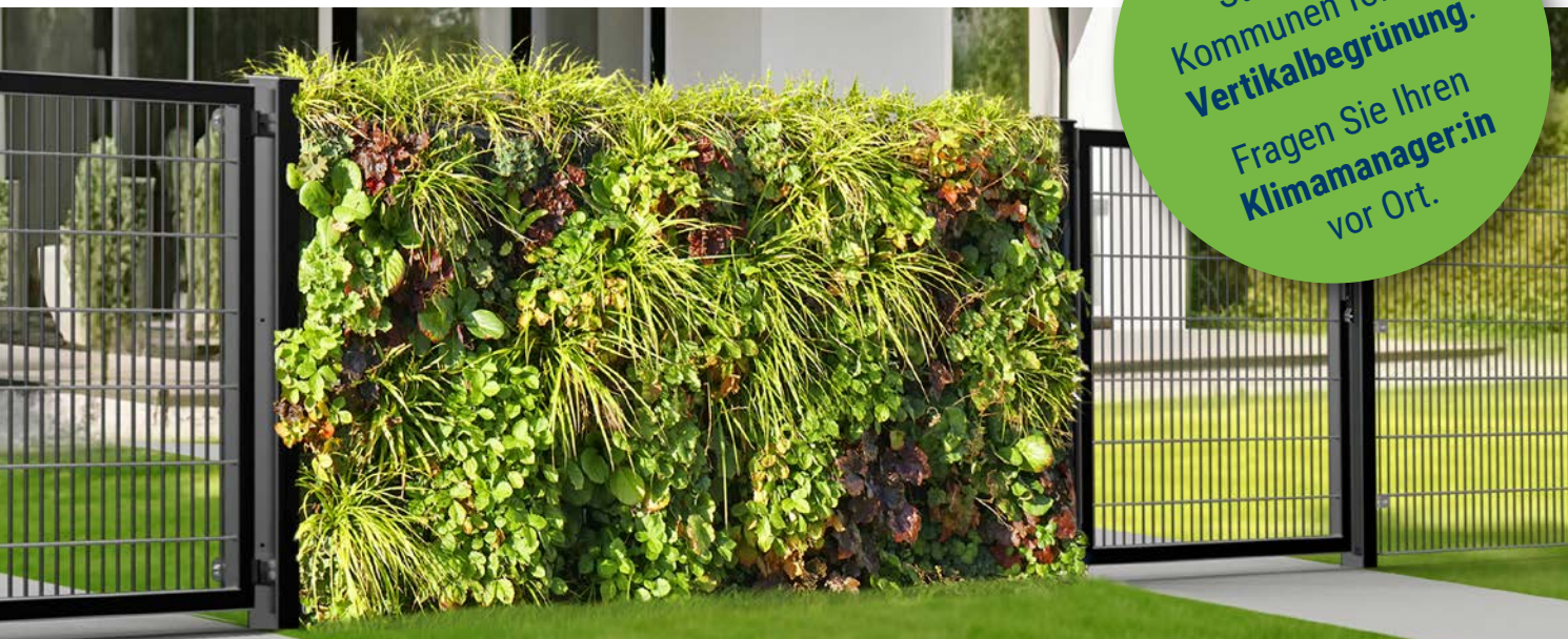
Die RANKO Pflanzen-Gabione macht auch in jedem Zaunverlauf eine gute Figur.

Viele Städte und Kommunen fördern Vertikalbegrünung . Fragen Sie Ihren Klimamanager:in vor Ort.