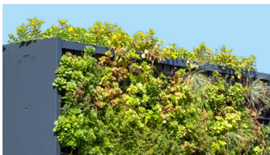
Cool gewählt: Die RANKO Pflanzen-Gabione verbessert das Mikroklima.

Zertifizierter Schallschutz nach DIN ISO EN 10140-2.