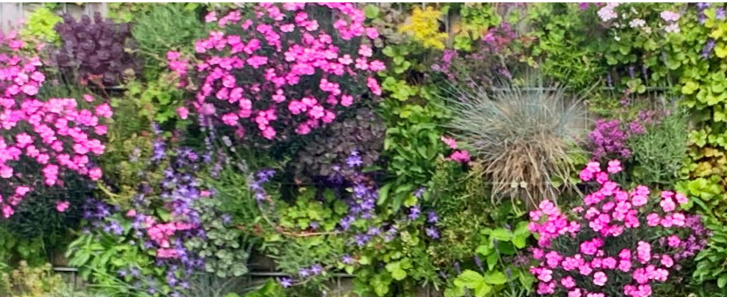
Die RANKO Pflanzen-Gabione – die Pflanzenvielfalt lässt keine Wünsche offen.