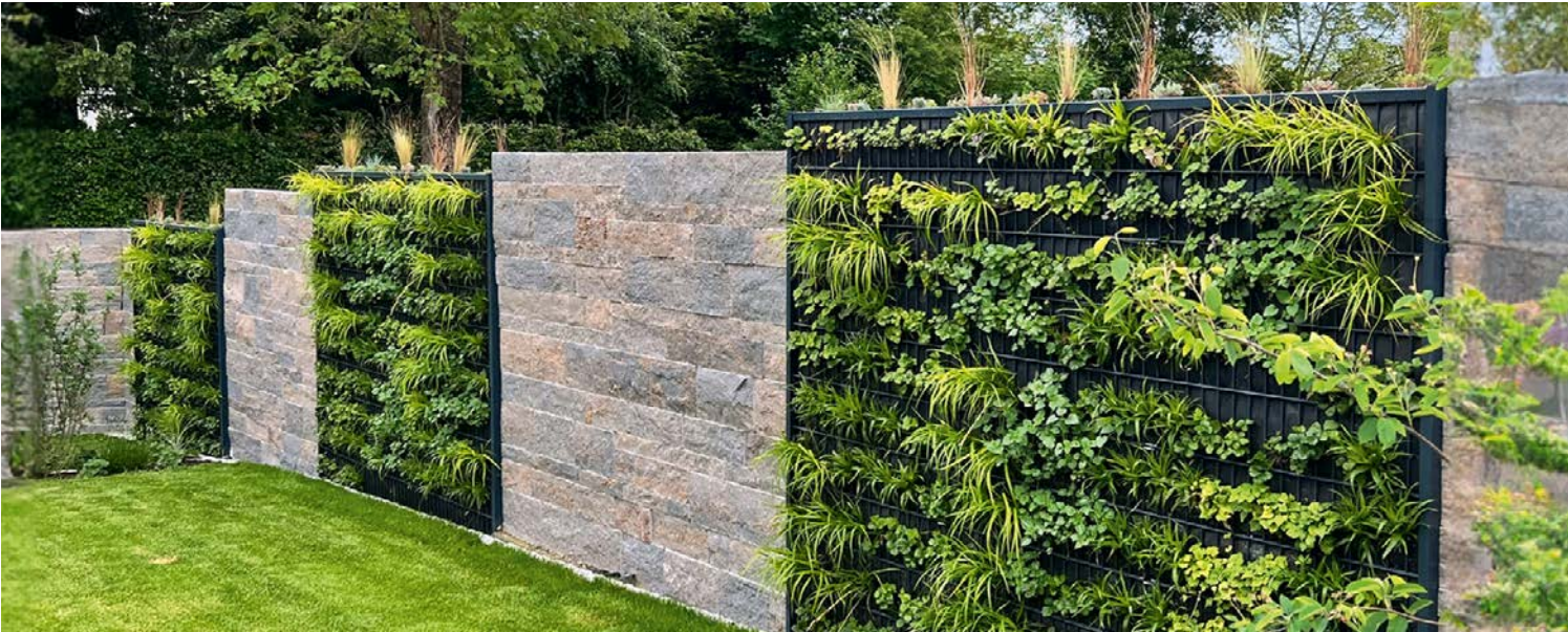
Die RANKO Pflanzen-Gabione gibt es mit ein- und beidseitiger Bepflanzung (Tiefe ca. 20 cm bzw. 30 cm).