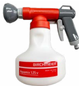
Birchmeier Aquamix Dünger-Spritze