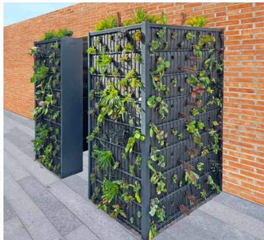
Ästhetik mit Funktion: Eck-Gabionen mit Eckelementen