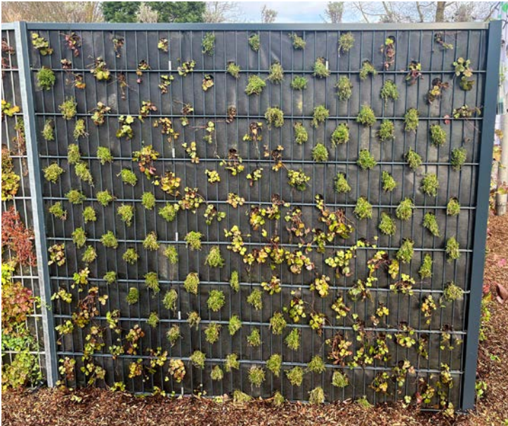
Frisch bepflanzt bereits ein stilvoller Schall- und Sichtschutz