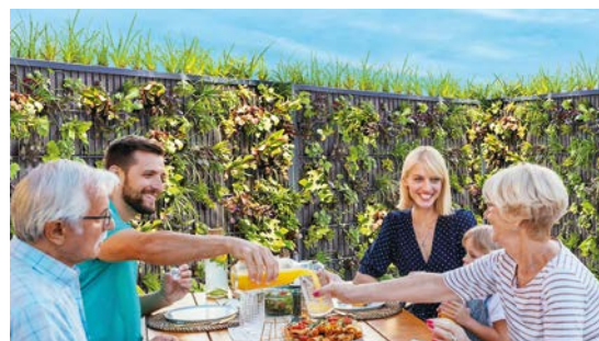
Wohlfühl-Atmosphäre: nachhaltiger Sicht- und Schallschutz – ökologisch wertvoll