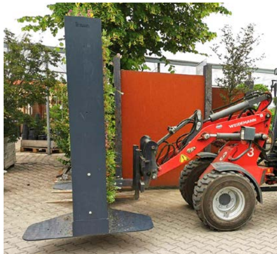
Die Mobile Gabione kann mit Stapler, Radlader oder Hubwagen transportiert werden.