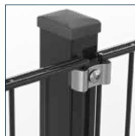
mit Klemmplatten mit langen Schenkeln