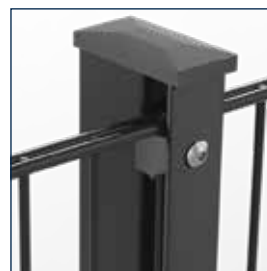
mit Flacheisen und Kappe mit Überstand