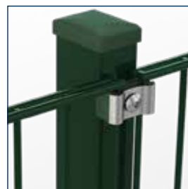
mit Klemmplatten mit kurzen Schenkeln