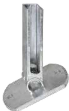
Perfekt zum RANKO Multipfahl : die Flexi-Bodenplatte von RANKO

Der Pfahl ist für Zaunhöhen von 600 mm bis 2430 mm verfügbar.